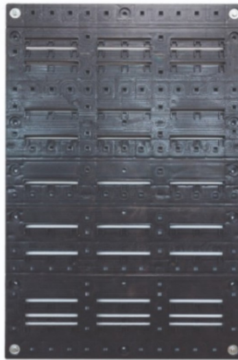
Εικόνα 2: Ενδεικτική Βάση στήριξης - Grid

Β) Πλαστικούς υποδοχείς -σκαφάκια (Holds/ Trays) για την τοποθέτηση των φυτών τα οποία θα καλύψουν όλη την επιφάνεια των περιστρεφόμενων πάνελ (Εικόνα 2). Θα χρειαστούν συνολικά πενήντα έξι (56) υποδοχείς ενδεικτικών διαστάσεων 50x13x15. Οι υποδοχείς θα περιλαμβάνουν επίσης τα απαραίτητα εξαρτήματα (leaf screen και drain hose) που απαιτούνται για το σύστημα ποτίσματος των φυτών του πράσινου τοίχου.