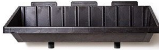
Εικόνα 3: Holds/ Trays

Γ) Σύστημα αυτόματου ποτίσματος το οποίο θα υποστηρίζει όλο τον προαναφερόμενο εξοπλισμό που θα τοποθετηθεί στα περιστρεφόμενα πάνελ.