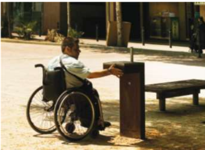
Εικ.1 Κοινόχρηστη βρύση που εξυπηρετεί και Άτομα Μειωμένης Κινητικότητας

Σε τρία επιλεγμένα σημεία του Δημοτικού Κήπου τοποθετείται νέος εξοπλισμός με βρύσες κατάλληλες για χρήση και από άτομα που χρησιμοποιούν αναπηρικό αμαξίδιο όπως φαίνεται στην εικόνα 1.