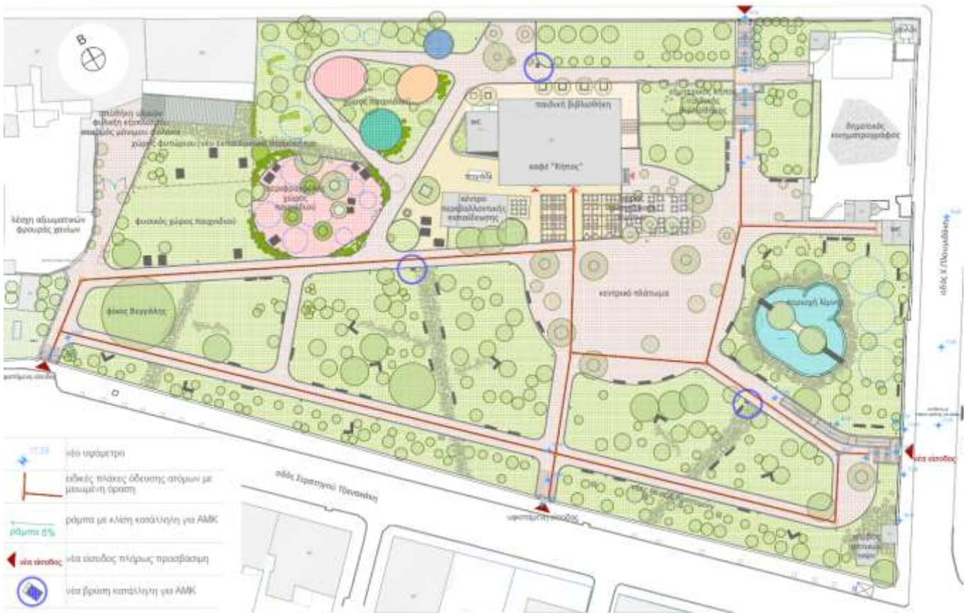
Εικ.2 Κάτοψη της μελέτης προσβασιμότητας Δημοτικού Κήπου Χανίων