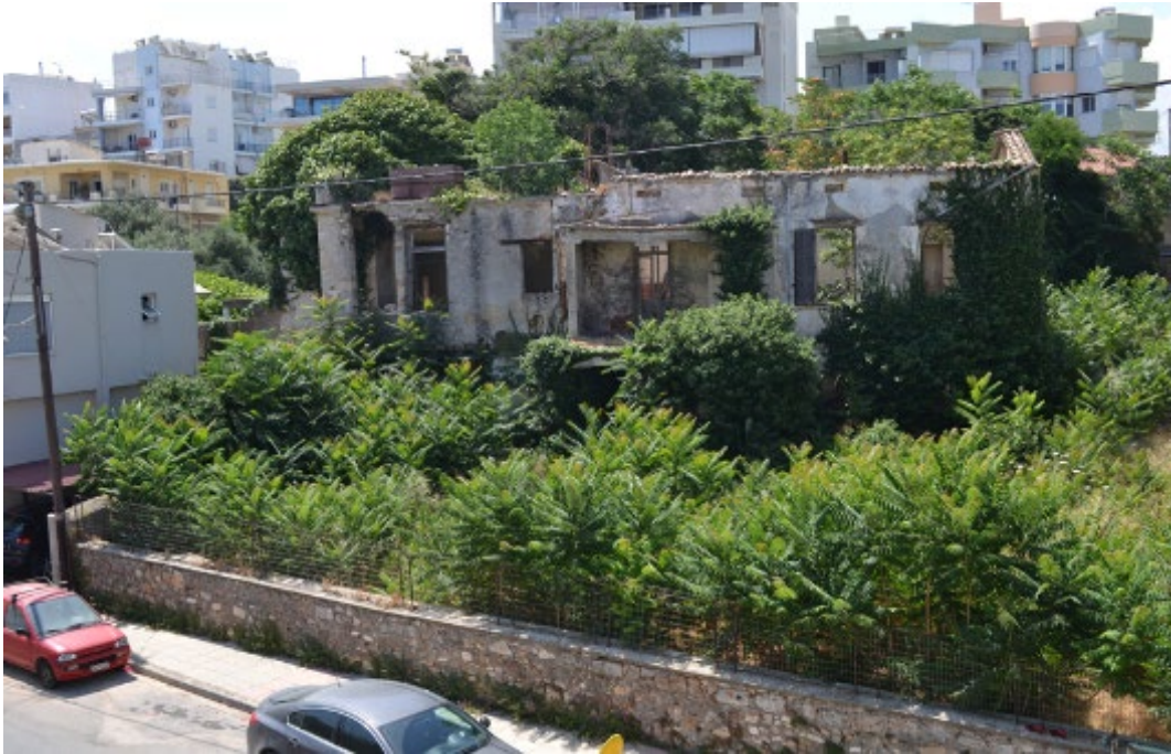
Εικόνα 1 : Βόρεια όψη