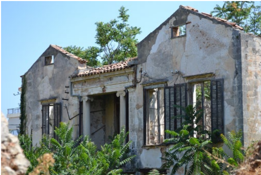
Εικόνα 2: Δυτική όψη