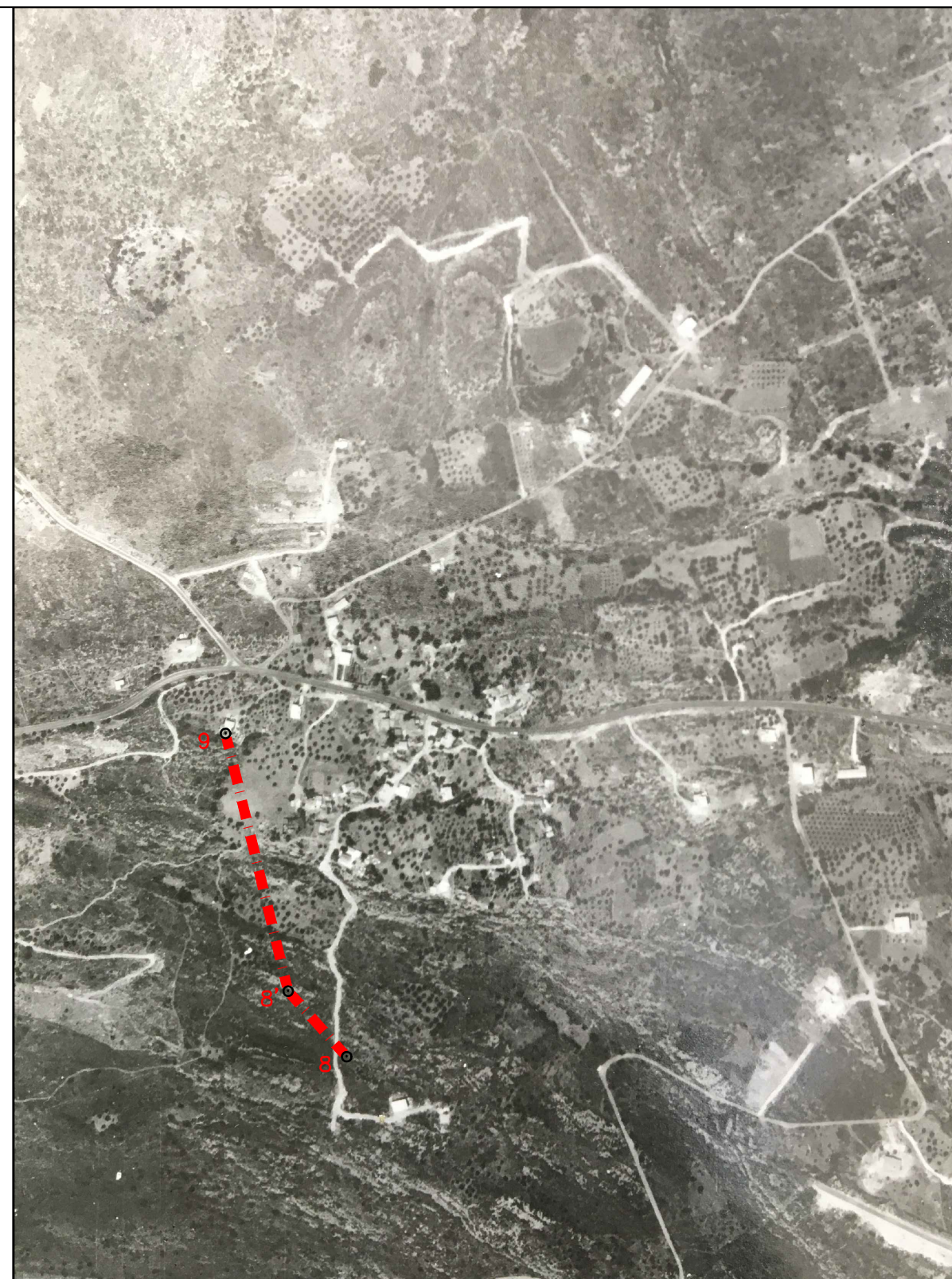
ΑΕΡΟΦΩΤΟΓΡΑΦΙΑ Γ.Υ.Σ. ΗΜΕΡΟΜΗΝΙΑΣ ΛΗΨΗΣ 1983 ΚΛΙΜΑΚΑ 1: 5.000